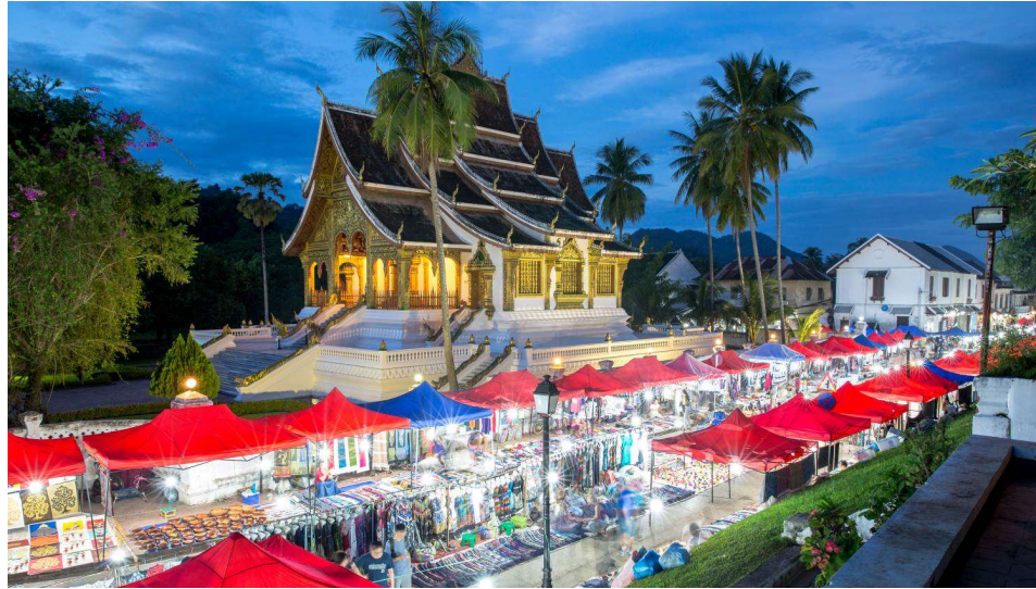
ที่พักระดับ 4 ดาว LE BEL AIR RESORT LUANG PRABANG หรือเทียบเท่า